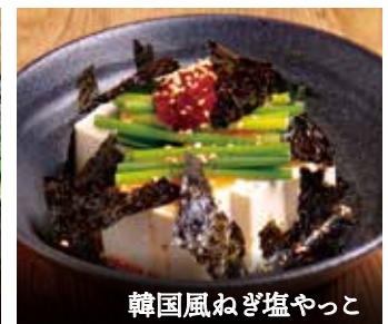
韓国風ねぎ塩やっこ

韓国のり 220円(税込242円) 塩キャベツ[ガーリック風味] 250円(税込275円) 焼肉屋さんのうまダレキャベツ 250円(税込275円) 枝豆 290円(税込319円) ネギサラダ 290円(税込319円) 豆もやしナムル 350円(税込385円) やみついきゅうり 390円(税込429円) セセリポン酢 390円(税込429円)