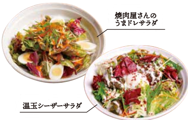
温玉シーザーサラダ