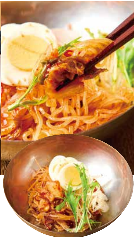
やみつき辛うま冷麺