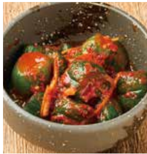
オイキムチ[きゅうり]