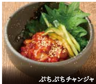
ぶちぶちチャンジャ