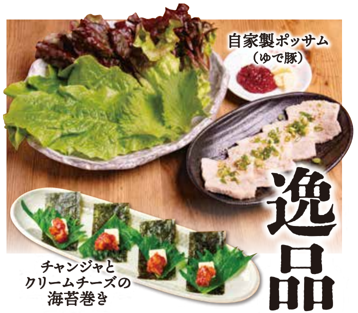
自家製ポッサム (ゆで豚)