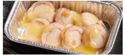
ほたてのガリパタホイル焼き(7個)