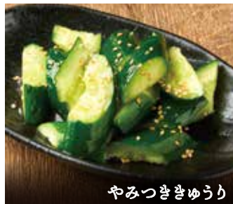
やみついきゅうり