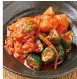
キムチ3種盛合せ [白菜・大根・きゅうり]