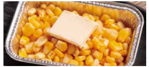
コーンのホイル焼き