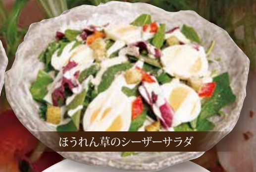
ほうれん草のシーザーサラダ