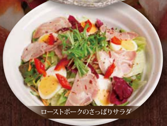
ローストポークのさっぱりサラダ