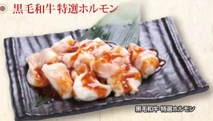
黒毛和牛特選ホルモン