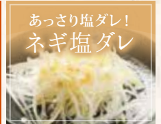
あっさり塩ダレ! ネギ塩ダレ