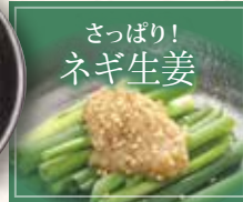
さっぱり! ネギ生姜