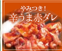
やみつき! 辛うま赤ダレ