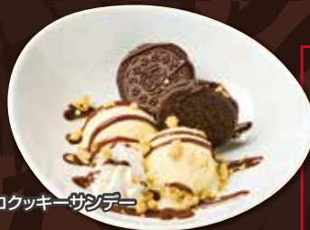
チョコクッキーサンデー