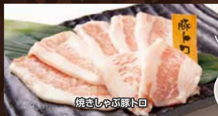
焼きしゃぶ豚トロ