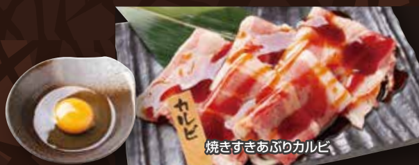
焼きすきあぶりカルビ