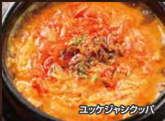
ユッケジャンクッパ