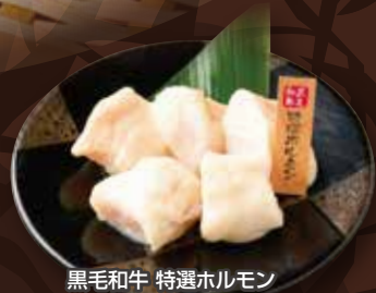
黒毛和牛 特選ホルモン