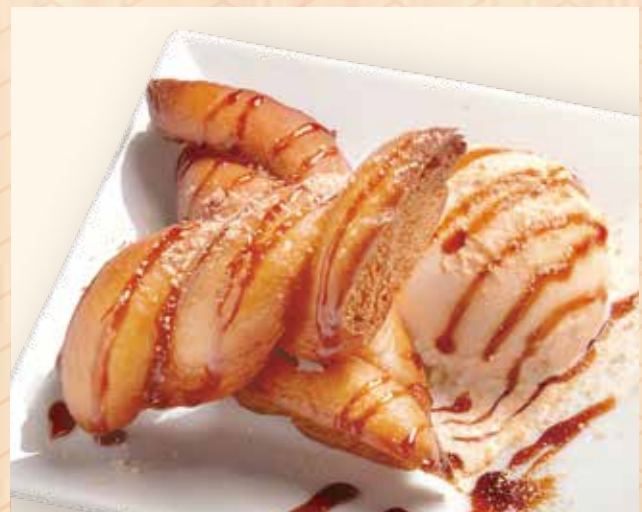
黒蜜きな粉揚げパンアイス