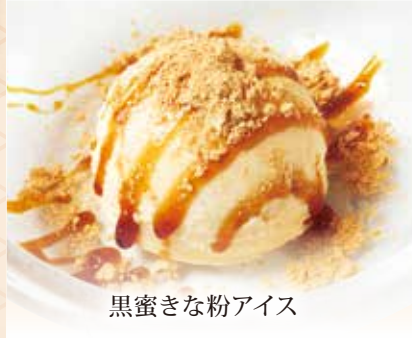
黒蜜きな粉アイス