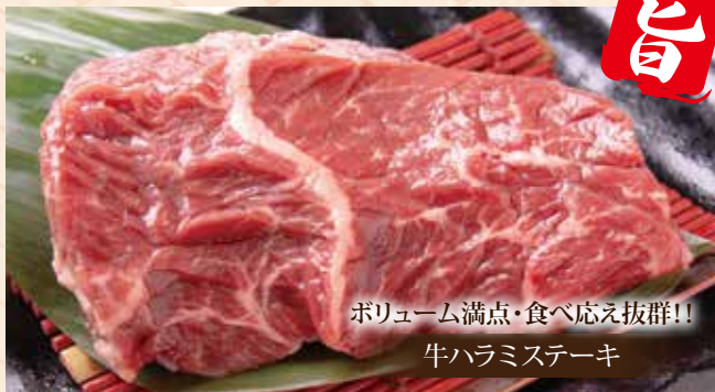
ボリューム満点・食べ応え抜群!! 牛ハラミステーキ