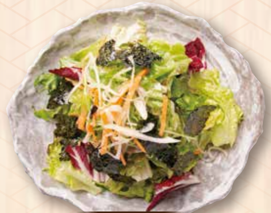
チョコレギサラダ