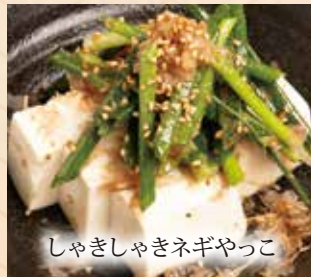
しやしやしきネギやっこ