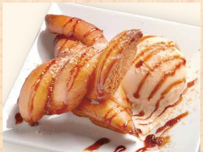
黒蜜きな粉揚げパンアイス