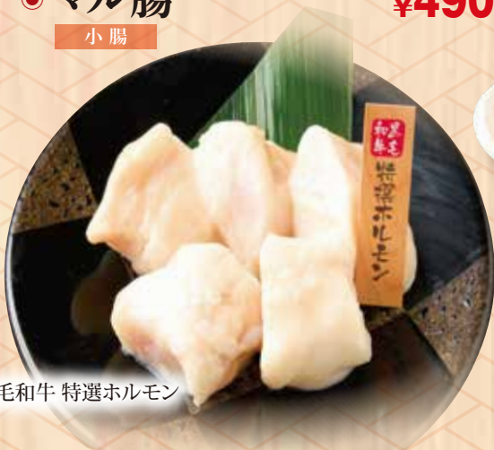
黒毛和牛 特選ホルモン