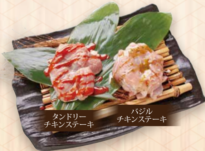
タンドリーチキンステーキ