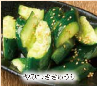
やみつききゅうり