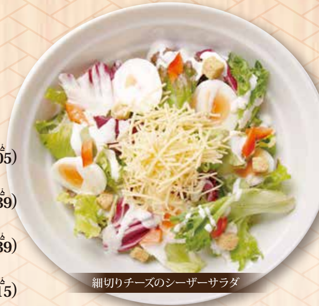
細切りチーズのシーザーサラダ