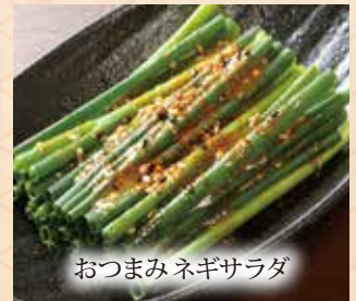
おつまみネギサラダ