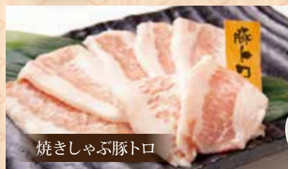
焼きしゃぶ豚トロ