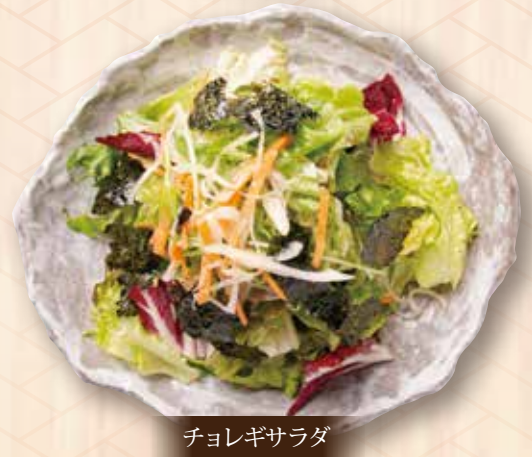
チョコレギサラダ