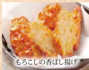
もろこしの香ばし揚げ