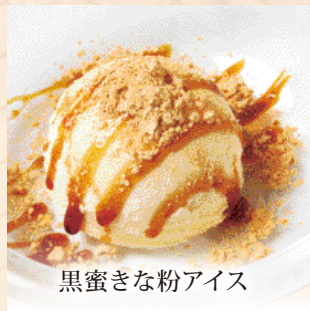
黒蜜きな粉アイス