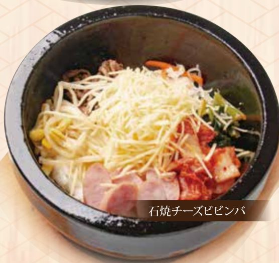
石焼チーズビビンバ