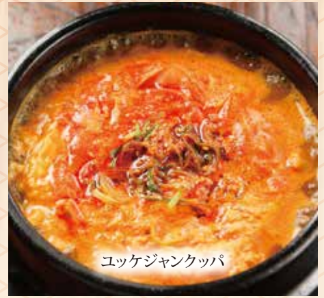
ユッケジャンクツパ