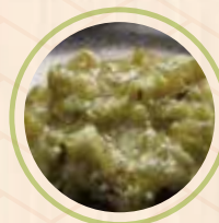
ジャキジャキわさび