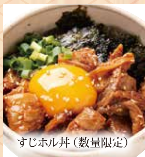
すじホル丼 (数量限定)