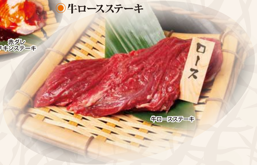
牛ロースステーキ