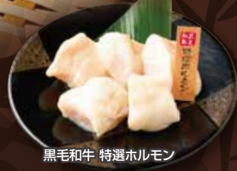
黒毛和牛 特選ホルモン