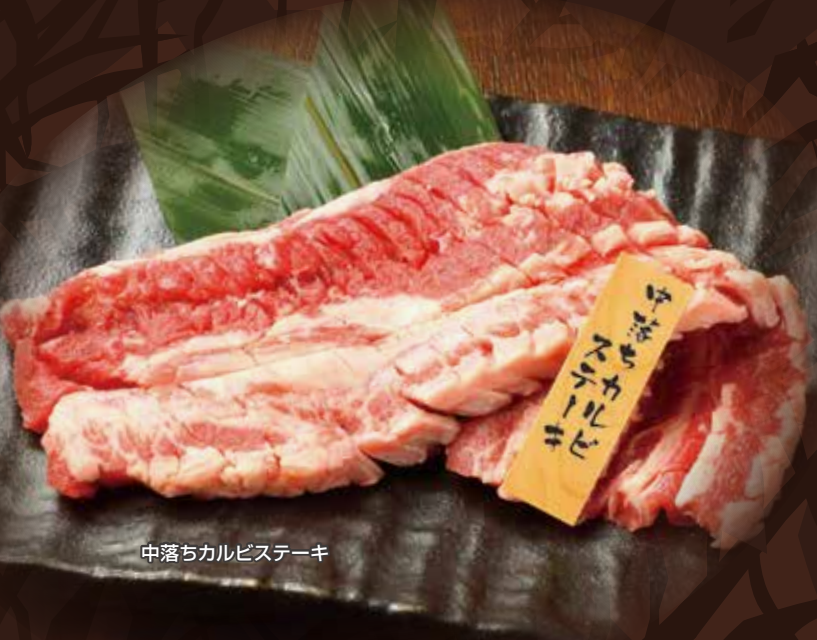
中落ちカルビステーキ