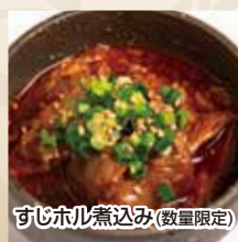
すじホル煮込み(数量限定)