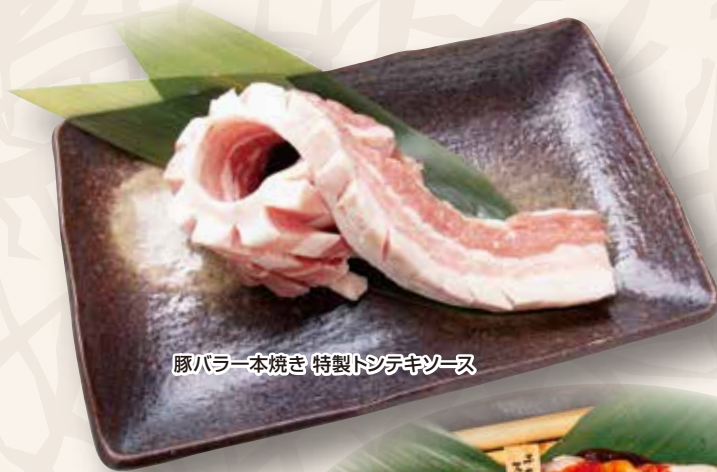
豚バラ一本焼き 特製トンテキソース