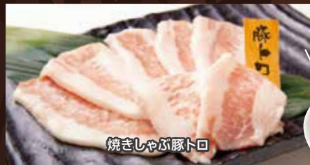
焼きしゃぶ豚トロ