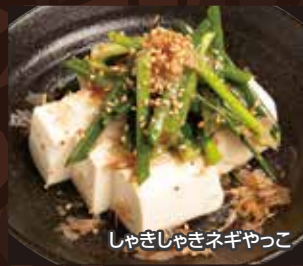
しゃきしゃきネギやっこ