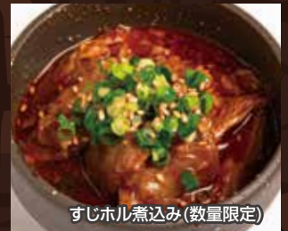
すじホル煮込み (数量限定)