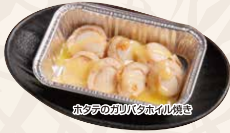
ホタテのガリバタホイル焼き