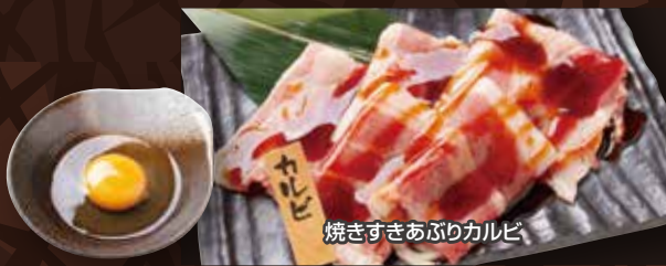
焼きすきあぶりカルビ