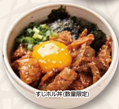
すじホル丼(数量限定)