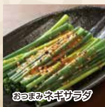
おつまみネギサラダ