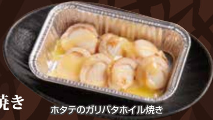
ホタテのガリバタホイル焼き