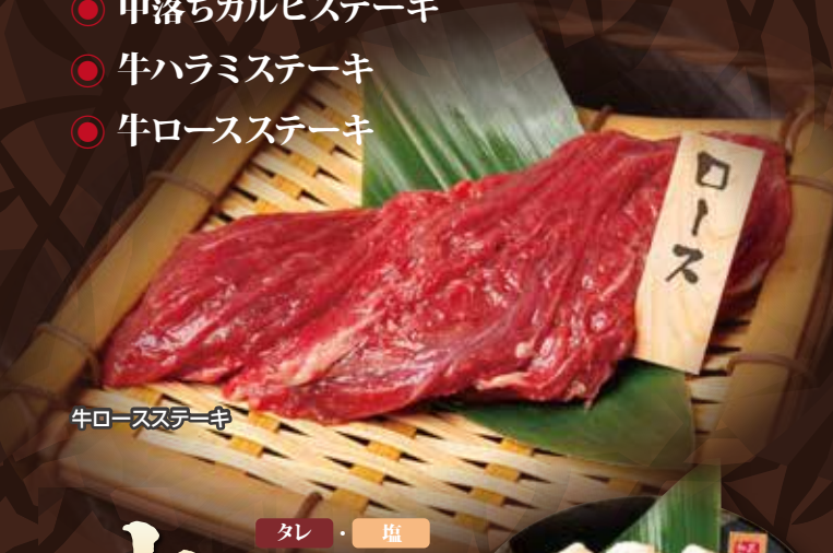
牛ロースステーキ