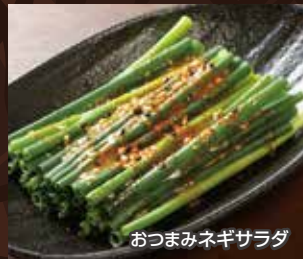
おつまみネギサラダ