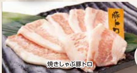
焼きしゃぶ豚トロ