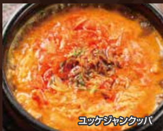
ユッケジャンクッパ