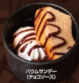
バウムサンデー (チョコソース)