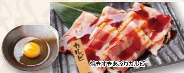
焼きすきあぶりカルビ