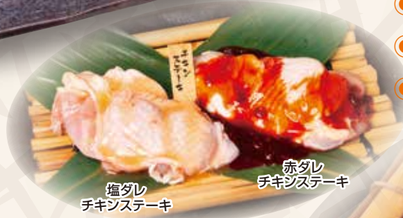
塩ダレチキンステーキ 赤ダレチキンステーキ