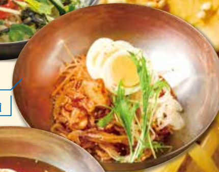
やみつき 辛うま冷麺