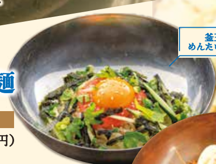
釜玉風 めんたいませ麺