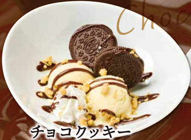
チョコクッキー サンデー 390円(税込429円)