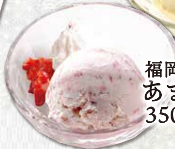
福岡県産 あまおういちごアイス 350円(税込385円)