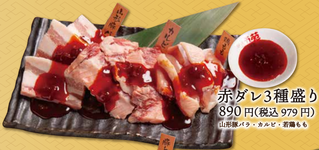
赤ダレ3種盛り 890円(税込 979円)

色んな種類を少量ずつ味わえるお得な盛り合わせ。 千円以下からお楽しみいただけます。