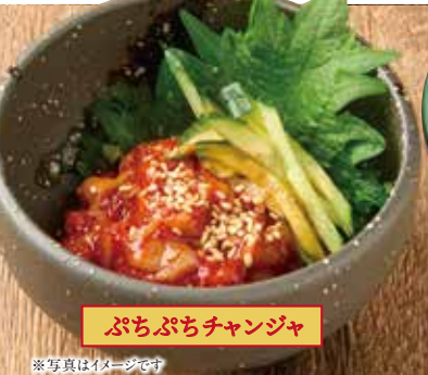
ぶちぶちチャンジャ