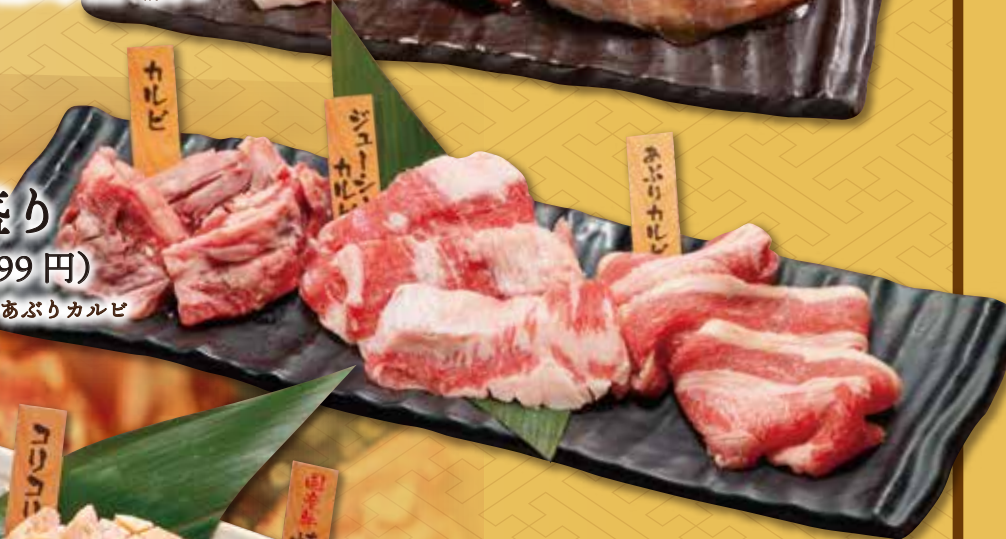
カルビ3種盛り 1,090円(税込 1,199円)