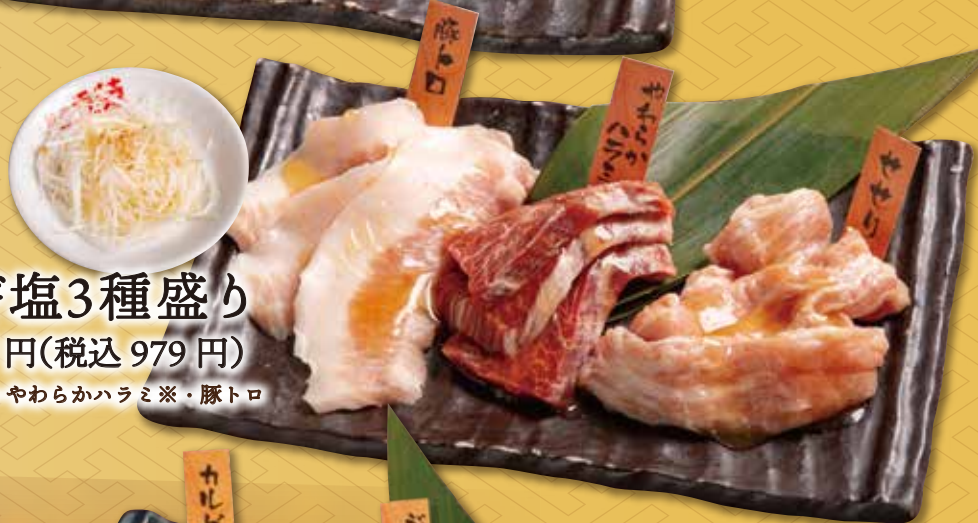
ネギ塩3種盛り 890円(税込 979円)