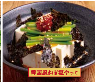
韓国風ねぎ塩やっこ