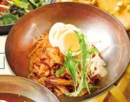
やみつき 辛うま冷麺