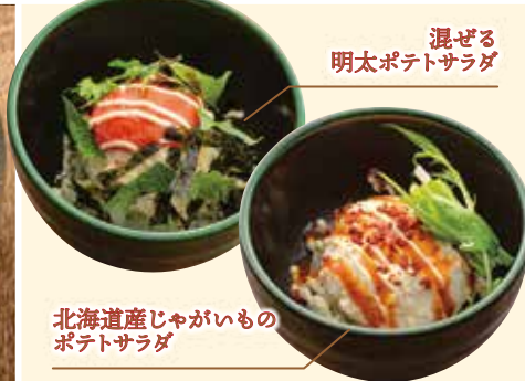
混ぜる 明太ポテトサラダ