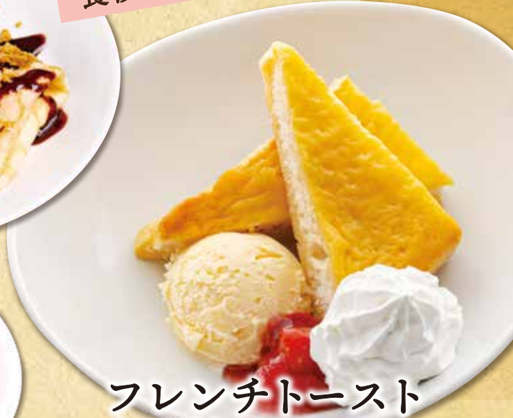
フレンチトースト とろけるバニラ 490円(税込539円)