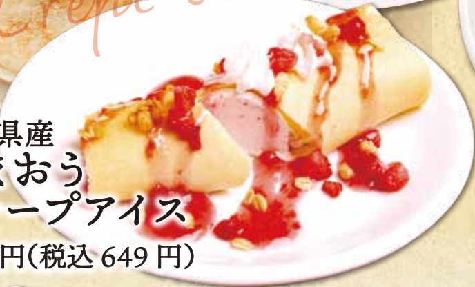
福岡県産 あまおう クレープアイス 590円(税込649円)