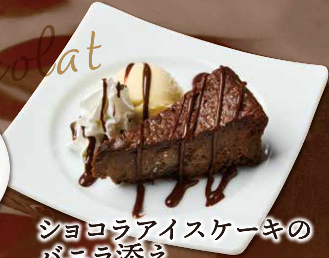
ショコラアイスケーキの バニラ添え 550円(税込605円)