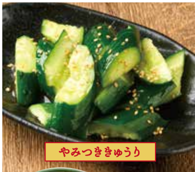
やみつききゅうり