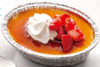
カタラーナアイス 490円(税込539円)