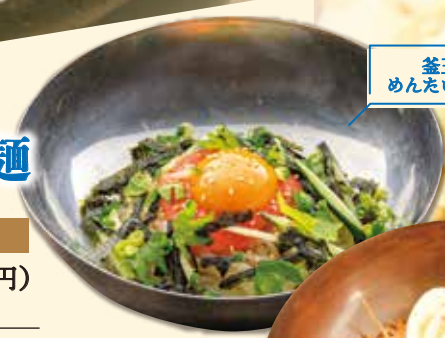
釜玉風 めんたいませ麺