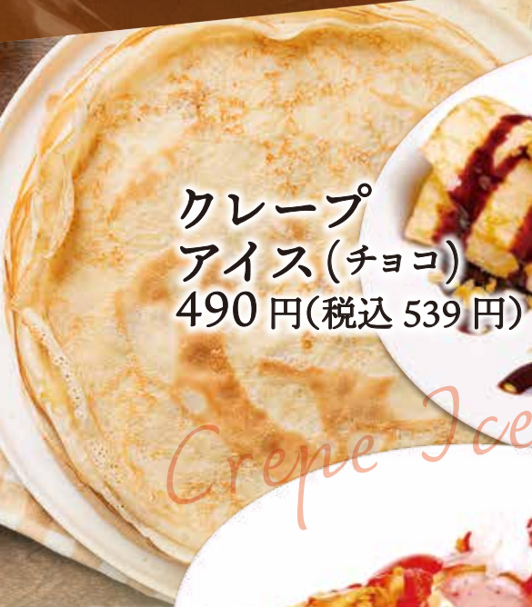
クレープ アイス(チョコ) 490円(税込539円)