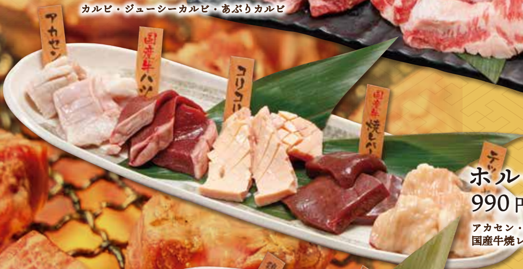
ホルモン5種盛り 990円(税込 1,089円)