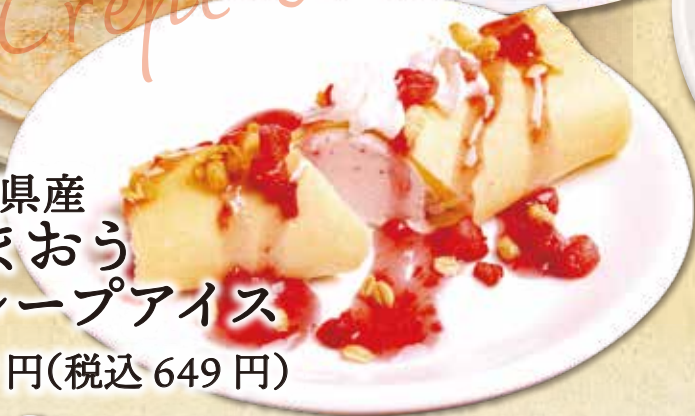
福岡県産 あまおう クレープアイス 590円(税込649円)