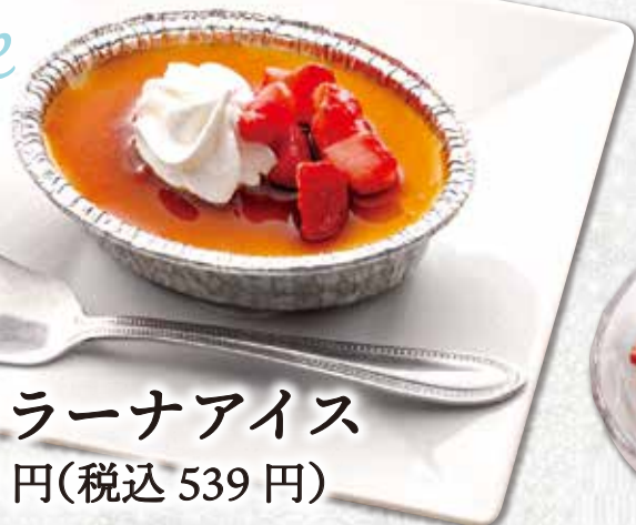
カタラーナアイス 490円(税込539円)