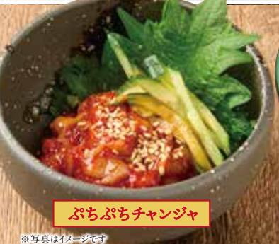
ぶちぶちチャンジャ