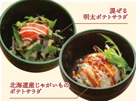
混ぜる 明太ポテトサラダ