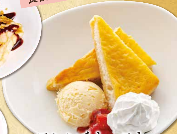
フレンチトースト とろけるバニラ 490円(税込539円)