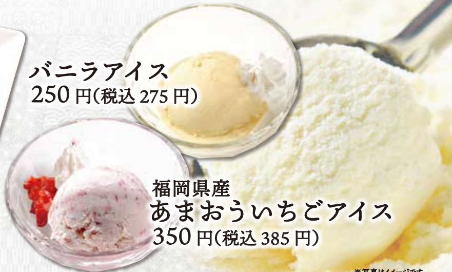
福岡県産 あまおういちごアイス 350円(税込385円)