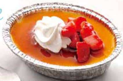
カタラーナアイス 490円(税込 539円)