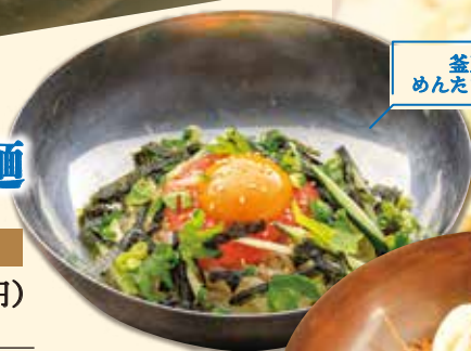
釜玉風 めんたいませ麺