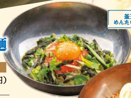
釜玉風 めんたいませ麺