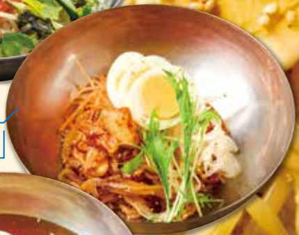
やみつき 辛うま冷麺