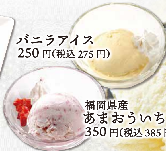
福岡県産 あまおういちごアイス 350円(税込385円)