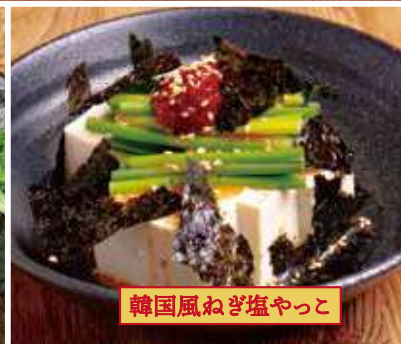
韓国風ねぎ塩やっこ