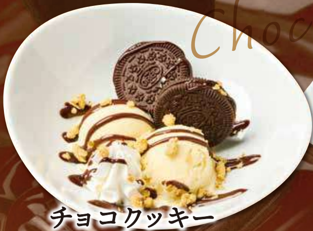
チョコクッキー サンデー 390円(税込429円)