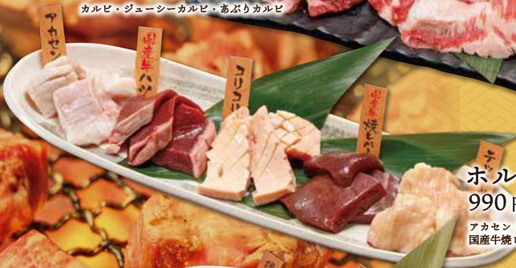
ホルモン5種盛り 990円(税込 1,089円)