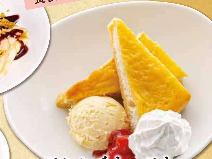
フレンチトースト とろけるバニラ 490円(税込539円)