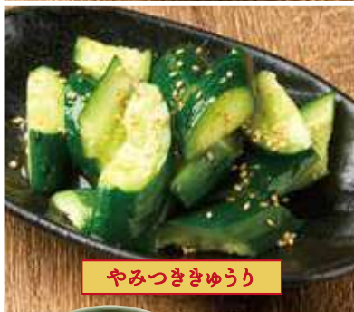
やみつききゅうり