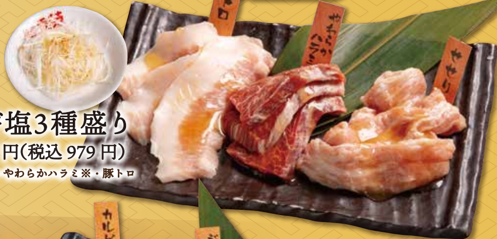
ネギ塩3種盛り 890円(税込 979円)