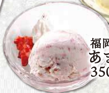
福岡県産 あまおういちごアイス 350円(税込385円)