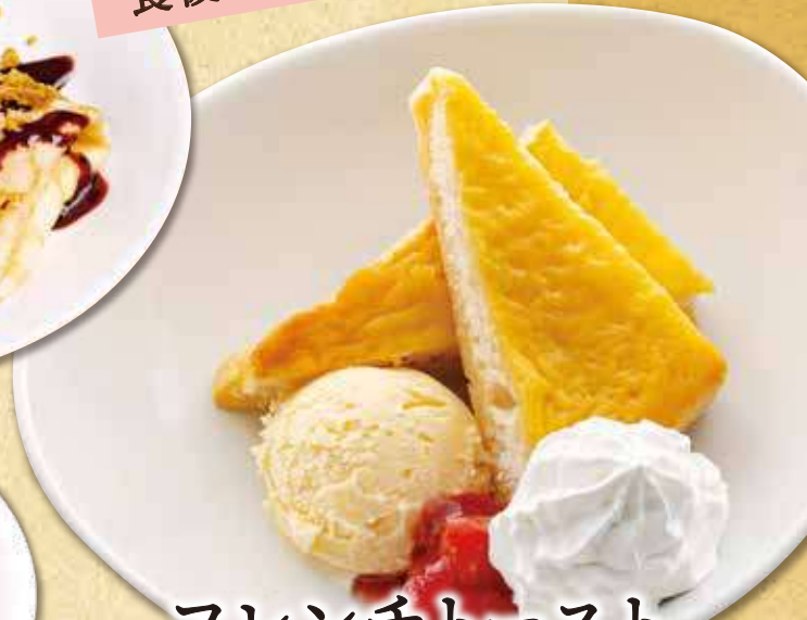
フレンチトースト とろけるバニラ 490円(税込 539円)