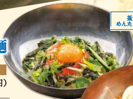
釜玉風 めんたいませ麺

盛岡冷麺 ハーフ 550円(税込 605円) レギュラー 850円(税込 935円)