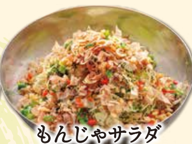
もんじゃサラダ 490 円(税込 539 円) もんじゃ焼き風のキャベツの千切りサラダ。ドレッシングや具材をよく混ぜてお召し上がりください。