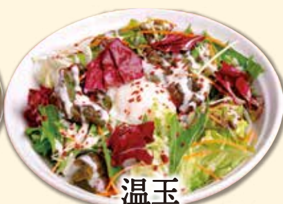
温玉シーザーサラダ 550 円(税込 605 円)