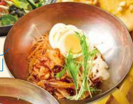
やみつき 辛うま冷麺