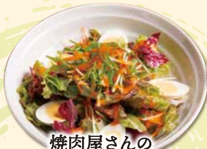
焼肉屋さんのうまドレサラダ 490 円(税込 539 円)

プチプチとした食感が特徴の沖縄県勝連(かつれん)産のもずくを使用したキムチです。