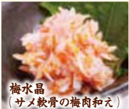
梅水晶 (サメ軟骨の梅肉和え)