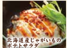
北海道産じゃがいものポテトサラダ