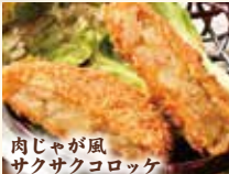
肉じゃが風サクサクコロケ