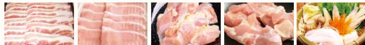
豚バラ 豚ロース 鶏ハラミ 若鶏もも 野菜盛り合わせ