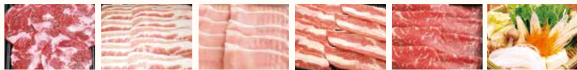
牛タン(タンシタ使用) 豚バラ 豚ロース 牛カルビ(昆布だしのみ) 牛ロース(昆布だしのみ) 野菜盛り合わせ