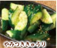
やみつききゅうり