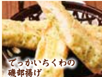
でっかいちくわの磯部揚げ